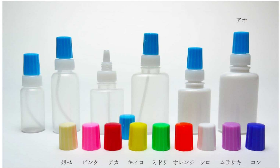
クリーム ピンク アカ キイロ ミドリ オレンジ シロ ムラサキ コン

※容器・容量の60%前後でご使用ください。 ※キャップ基本色は青、本体基本色は乳白です。 ただし丸10cc、丸20ccは原色になります。